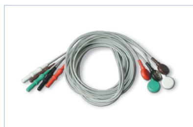
Cables para Electrodo tipo broche