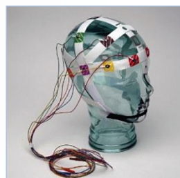
Plantillas de EEG