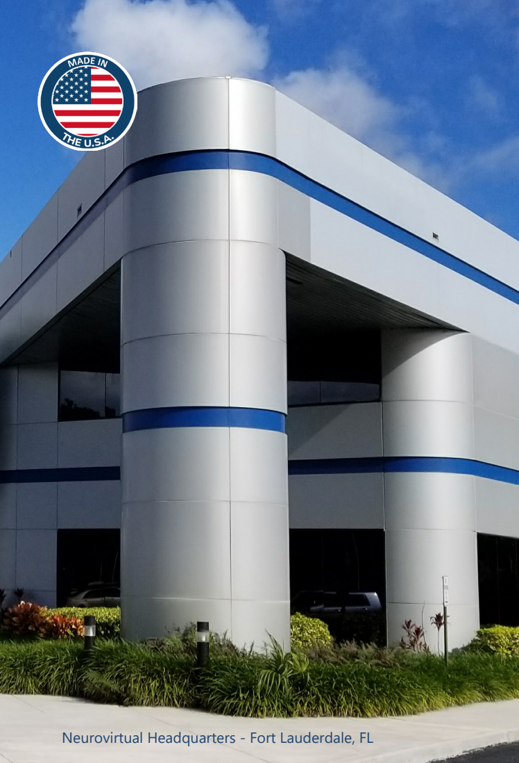
Neurovirtual Headquarters - Fort Lauderdale, FL